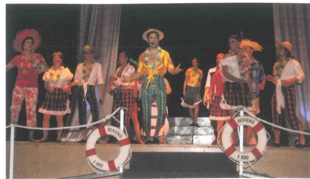
Soirée cabaret donnée par la Compagnie Létaincel

Si vous souhaitez participer à ces échanges, renseignez-vous auprès de Claude Festaz au 04 74 61 06 18.