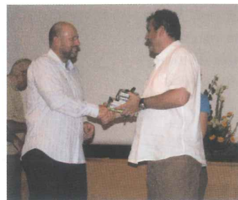
Traditionnel échange de présents par les maires respectifs des deux communes

Organisées par le Comité de jumelage et la mairie, ces rencontres sont l'occasion d'échanges culturels où chacun trouve un intérêt à découvrir l'autre, au travers de sa vie