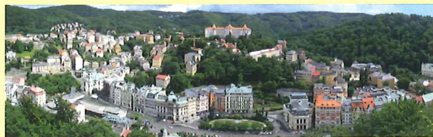
Station balnéaire Karlovy Vary

(Un prochain article viendra compléter le détail du programme ci-dessus.)