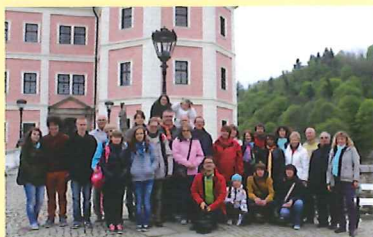
Délégation de Villieu Loyes Mollon devant le château de Becov

4 mai : Fin du séjour, devant la mairie de Dobrichovice, "au revoir" aux familles d'accueil à 8 h 30 et retour en direction de Villieu Loyes Mollon.