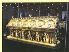
Reliquaire de St Maurice