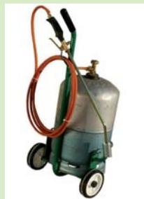
Modèle de désherbeur thermique utilisé par le personnel technique de la mairie