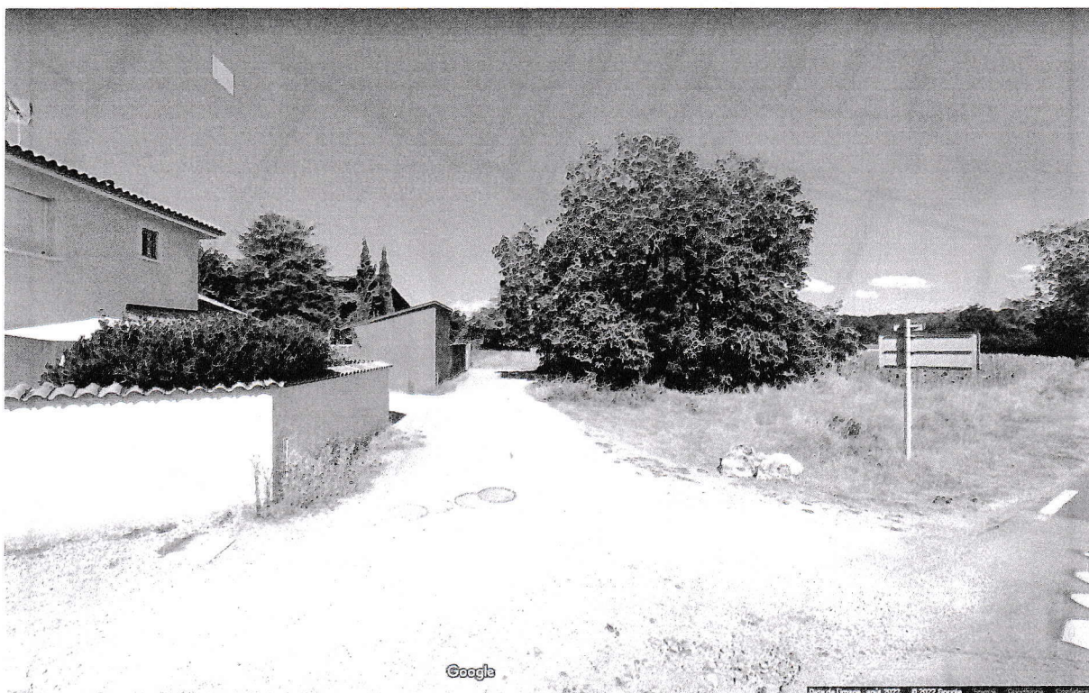
Figure 1 : pas de covisibilité depuis la propriété Dubois en direction du château de Villieu

Monsieur Dubois Raymond LOTISSEMENT LA FERME DU JANIVON 01800 VILLIEU-LOYES-MOLLON